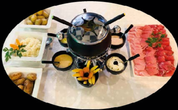
Fondue Chinoise mix 16,50 € Fondue Chinoise

Ternera / Beef 18,90 € Cerdo / Pork 15,90 € Pollo / Chicken 14,90 €