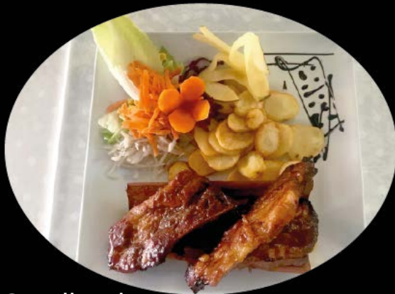
Costillas de cerdo caseras 11,50 € Homemade Spareribs,