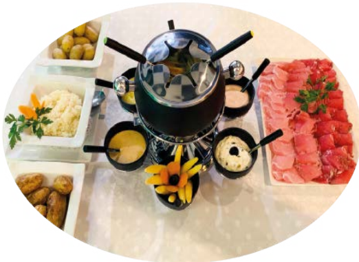
Kinesisk fondue mix 16,50 € Chinesisches Fondue