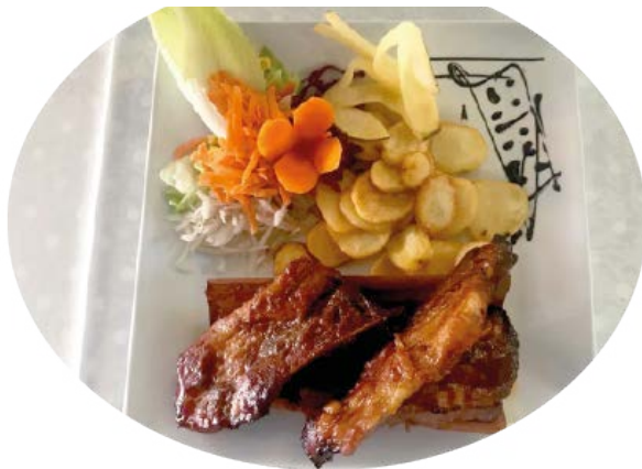
Spareribs hjemmelaget 11,50 € Spareribs, hausgemacht