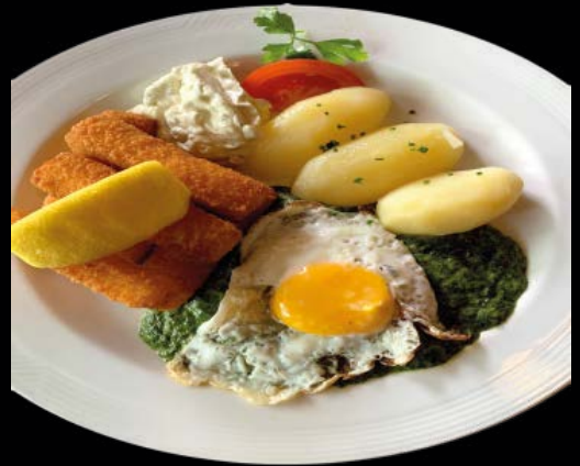
Palitos de pescado 9,90 € Fish sticks

Ternera / Beef 18,90 € Cerdo / Pork 15,90 € Pollo / Chicken 14,90 €