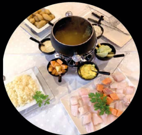
Fondue de pescado 17,90 € Fish Fondue

GRACIAS POR SU VISITA. Precios EUR +10% IVA THANK YOU FOR YOUR VISIT. Prices EUR +10% VAT