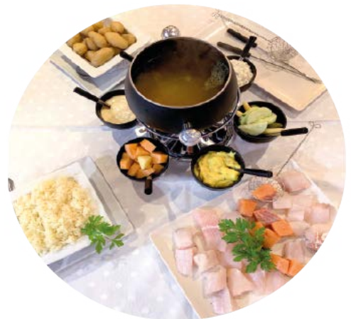
Fisk Fondue 17,90 € Fischfondue

GRACIAS POR SU VISITA. Precios EUR +10% IVA THANK YOU FOR YOUR VISIT. Prices EUR +10% VAT