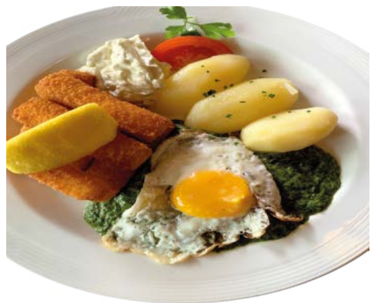
Fiskestenger 9,90 € Fischstäbchen